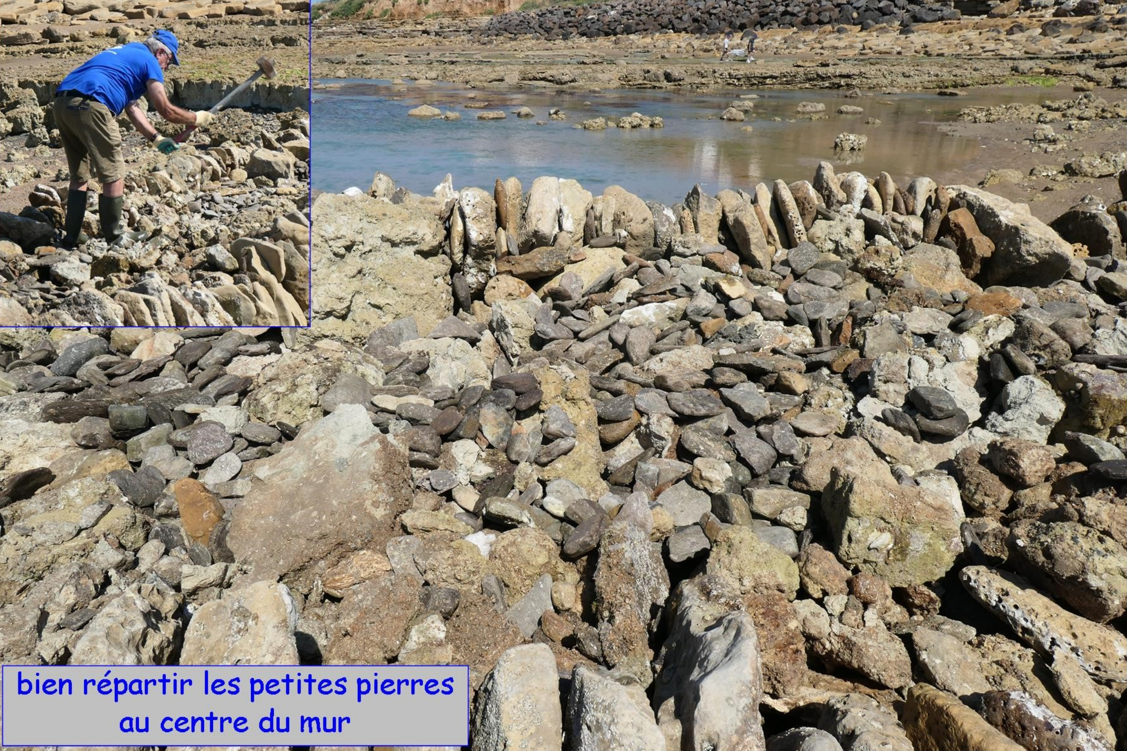
bien répartir les petites pierres au centre du mur