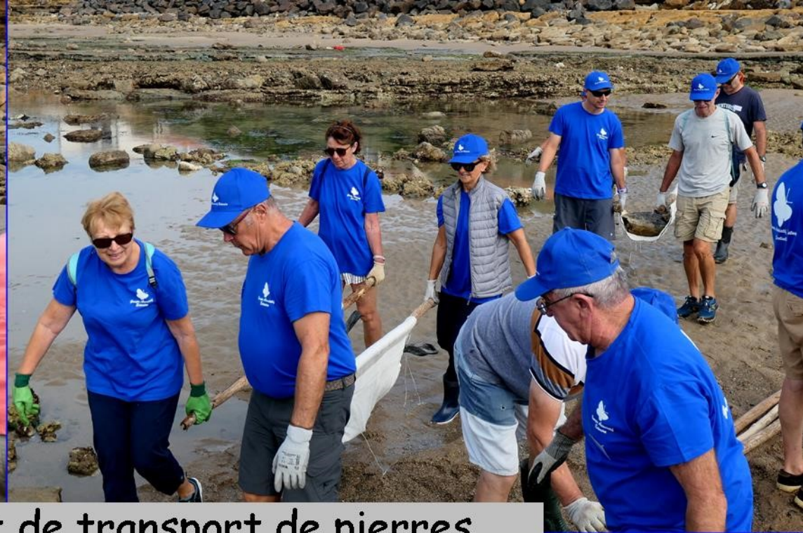
les équipes de sélection et de transport de pierres ...