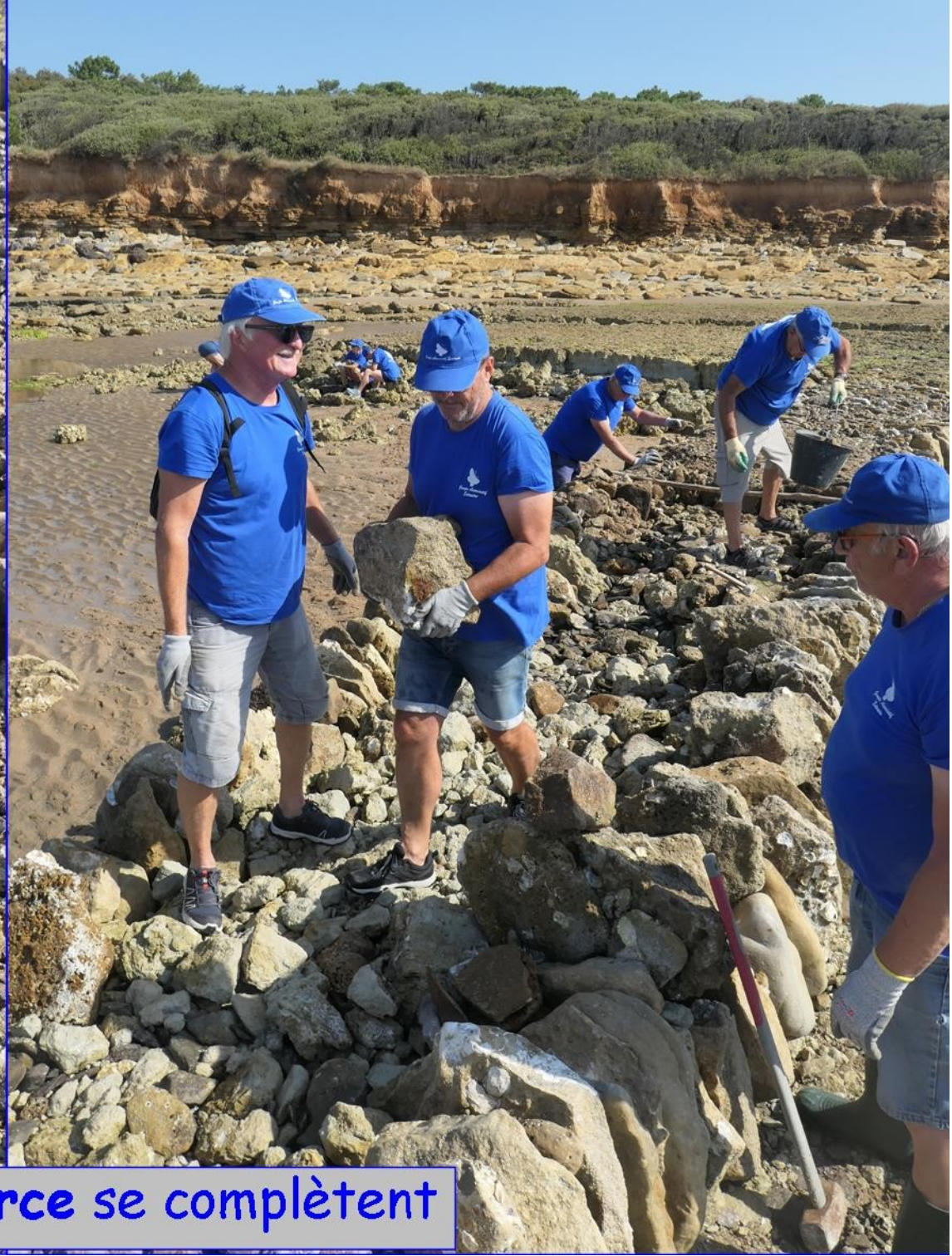
précision et force se complètent